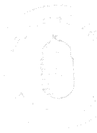
Kovács Lajos Polgármester