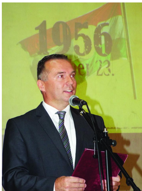
2016. október 21-én a városi művelődési ház nagytermében került sor az 1956-os

Forradalom és Szabadságharc tiszteletére rendezett ünnepi megemlékezésre.