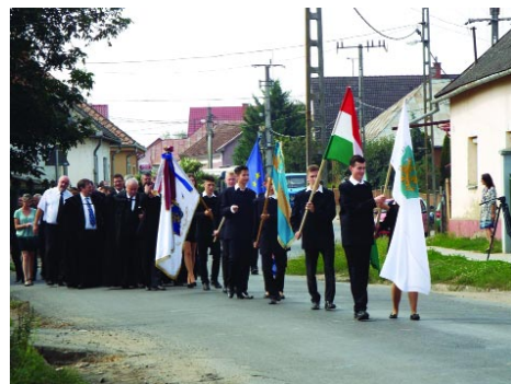
Zenebarátok Kórusa. Az istentiszteletet követően szabadtéri programokkal folytatódott a rendezvény.