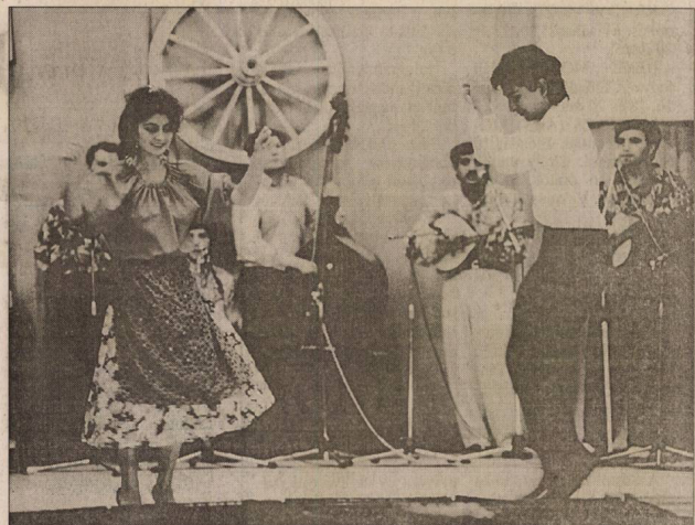
A nagyecsedői művelődési ház színpadán a sátoraljuhelyiek

A fesztiválon talán a legnagyobb sikere a táncgyűjtések bemutatkozásának volt. Nívódíjjal részesült a Majaki Lulugyi, a Kék Láng (Nyírvasvári), a Nagykanizsai és a Sátoraljuhelyi Cigány Táncgyűjtés, a Vadvirág (Nagyecsed), a Rom po Drom (Győr) és a Rom Szom (Budapest) együttes.